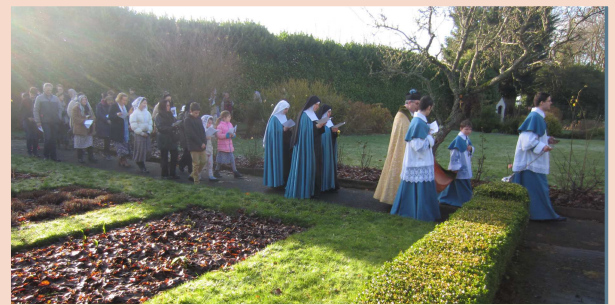
Procession dans les jardins d'Ardee