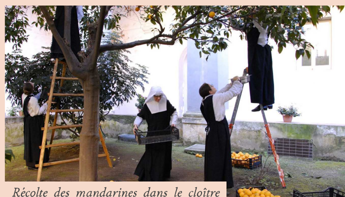
Récolte des mandarines dans le cloître

Notre vie quotidienne nous offre de nombreux et divers travaux. Dieu premier servi, nos journées sont d'abord ancrées dans l'Adoration du Saint-Sacrement, dans la prière liturgique et le chant de l'Office Divin. Au noviciat, la formation continue des novices et des postulantes comprend également quatre heures de cours quotidiens, auxquels s'ajoutent les instructions données par la maîtresse des novices. Puis se succèdent les travaux d'entretien du grand couvent et du jardin riche en agrumes. La récolte des fruits et leur transformation occupent une grande partie de la journée des sœurs. Plus de 1200 citrons, et autant d'oranges, nous permettent de confectionner plus de 500 pots de confitures destinés à la vente. Avec le zeste des fruits, afin de ne rien perdre, les sœurs confectionnent également du limoncello, spécialité italienne très appréciée. Et chaque samedi, environ 300 palmiers et orangettes, pâtisseries que les Napolitains affectionnent, sortent de la cuisine du couvent pour rejoindre le petit magasin et ainsi aider aux nécessités de la maison.