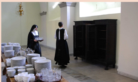
Installation du réfectoire de Naples entièrement repeint