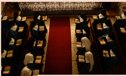
Le chant de l'Office Divin

Les sœurs professes réparties dans les différentes maisons de la communauté ont la joie de se retrouver chaque année pour une retraite prêchée dans une de leur maison. Cette année se fut dans la Maison du Cœur Eucharistique en Suisse. Outre les conférences quotidiennes et le chant de l'Office Divin en commun, le temps de la retraite annuelle est également l'occasion pour les professes de renouveler leurs vœux.