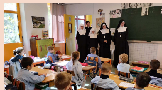
Les sœurs rendent visite à l'école Saint-Dominique du Pecq