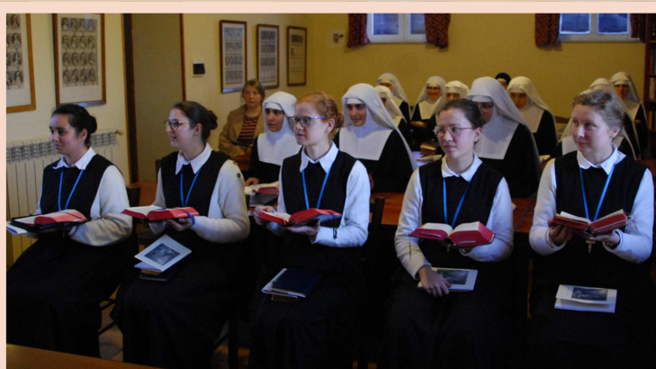
Cours de chant pour préparer la Semaine Sainte