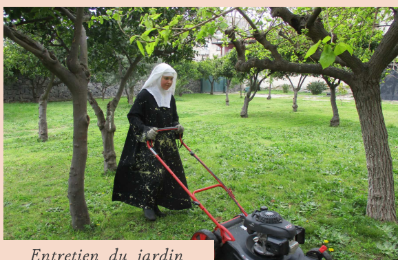
Entretien du jardin