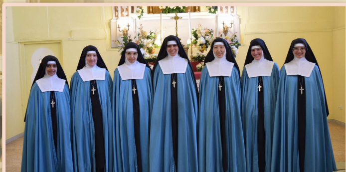
Sept nouvelles professes ont prononcé leurs vœux le 25 mars 2023