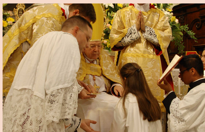
Le 29 septembre 2021, Son Eminence le Cardinal Pell a donné l'habit à quatre nouvelles novices