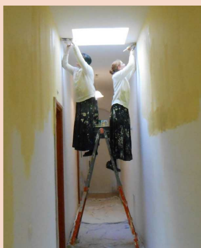
les postulantes repeignent le couloir des chambres