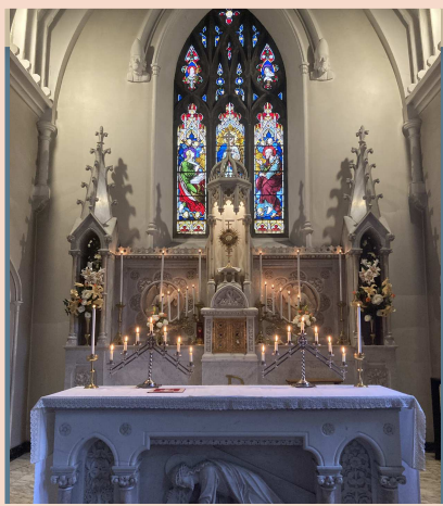
Adoration dans la chapelle d'Ardee