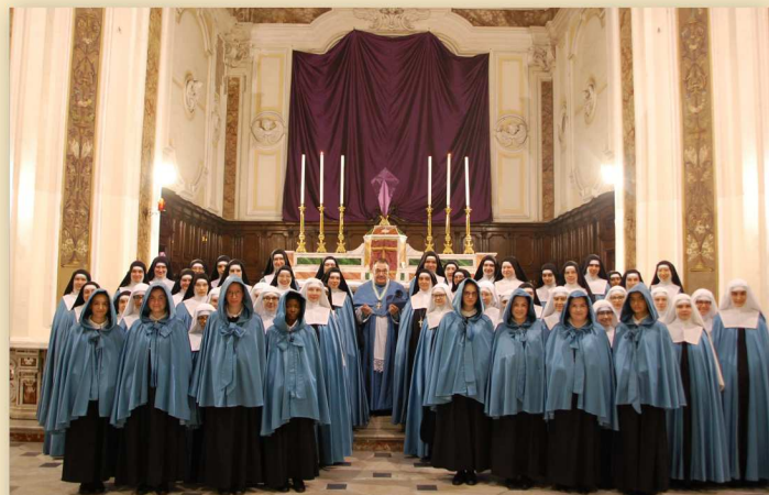
La communauté, à l'occasion des vœux de sept nouvelles professes pendant le Temps de la Passion

Mère Madeleine-Marie de St Joseph, Gardien du Cœur Royal Supérieure des Adoratrices