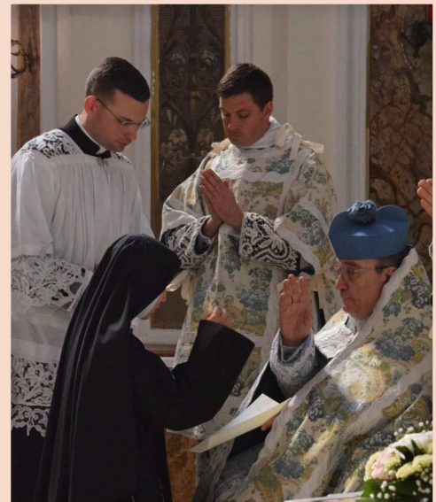
La nouvelle professe reçoit la bénédiction de Monseigneur le Prieur Général