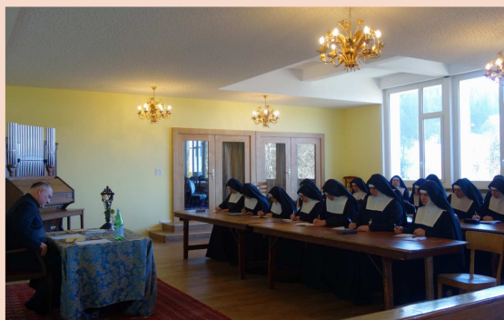
Conférence donnée aux professes pendant la retraite

Les sœurs professes réparties dans les différentes maisons de la communauté ont la joie de se retrouver chaque année pour une retraite prêchée dans une de leur maison. Cette année se fut dans la Maison du Cœur Eucharistique en Suisse. Outre les conférences quotidiennes et le chant de l'Office Divin en commun, le temps de la retraite annuelle est également l'occasion pour les professes de renouveler leurs vœux.