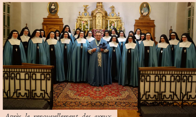
Après le renouvellement des vœux