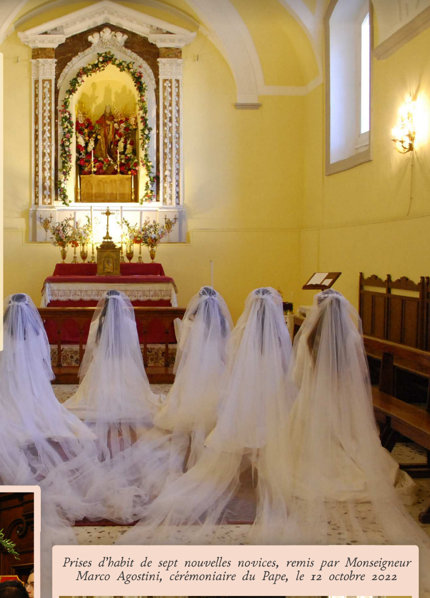
Prises d'habit de sept nouvelles novices, remis par Monseigneur Marco Agostini, cérémoniaire du Pape, le 12 octobre 2022

Lors de la cérémonie des prises d'habit, les postulantes s'avancent en robe de mariée jusqu'à l'autel où elles reçoivent le Saint Habit qui est béni par le prélat. Au cours de la cérémonie, elles reçoivent également leur nom de religion. La prise d'habit marque l'entrée de la sœur au noviciat.