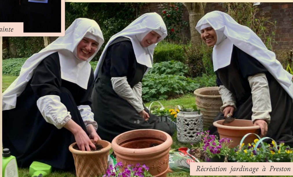
Récréation jardinage à Preston