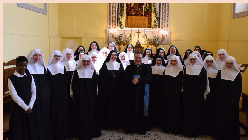
Après la cérémonie des prises d'habit, dans la salle du Chapitre