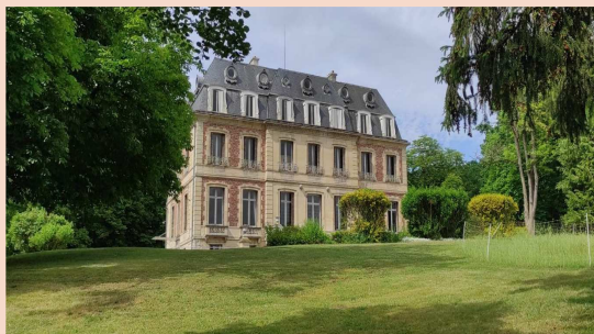
La Maison Notre-Dame-de-Bonne-Délivrance à Loisy

En France, nous avons pris la suite des sœurs de Saint-Thomas-de-Villeneuve qui avaient fait de cette grande maison un centre de prière dans un cadre magnifique. Dans ces lieux déjà bien aménagés pour l'hôtellerie, cinq sœurs accueillent aussi bien les personnes qui désirent faire une retraite ou passer quelques jours dans le silence et le recueillement, que des groupes qui suivent des retraites prêchées. Le Saint-Sacrement, devant lequel les sœurs se relaient, reste exposé depuis la Messe jusqu'aux Vêpres. Ici encore, la prière des sœurs qui nous ont précédées est source de nombreuses grâces.