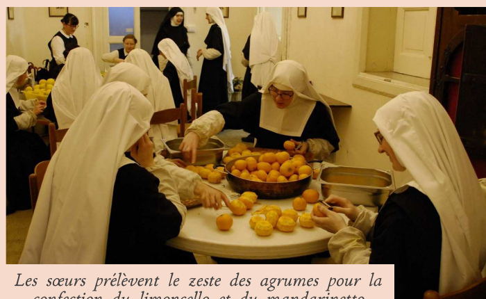
Les sœurs prélèvent le zeste des agrumes pour la confection du limoncello et du mandarinetto