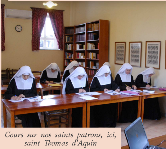
Cours sur nos saints patrons, ici, saint Thomas d'Aquin