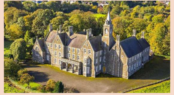
La Maison Notre-Dame-du-Très-Saint-Rosaire à Ardee en Irlande

Notre communauté a eu la grande grâce d'ouvrir récemment deux nouvelles maisons, une en Irlande en octobre 2021 et une en France en septembre 2022. En Irlande, le vaste couvent, tenu autrefois par les sœurs de la Miséricorde, a permis d'accueillir l'été dernier des colonies pour jeunes filles. Mais il ne nous est malheureusement pas encore possible de recevoir des hôtes : l'hôtellerie, trop vétuste, nécessite d'importants travaux qui dépassent les compétences des sœurs, notamment en matière de plomberie.