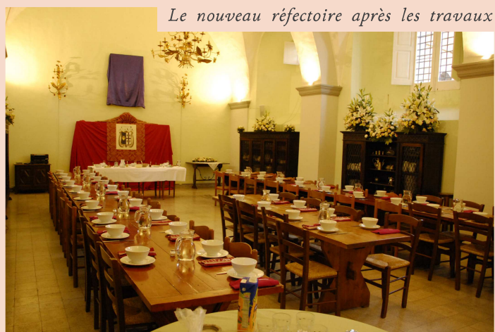
Le nouveau réfectoire après les travaux